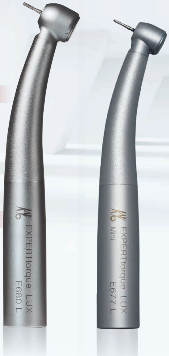
KaVo EXPERTtorque LUX E680 L