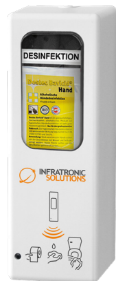
> Art-Nr. 19400-WC IT 500 AW EURO-2