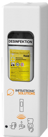
> Art-Nr. 19300-WC IT 1000 AW EURO-2